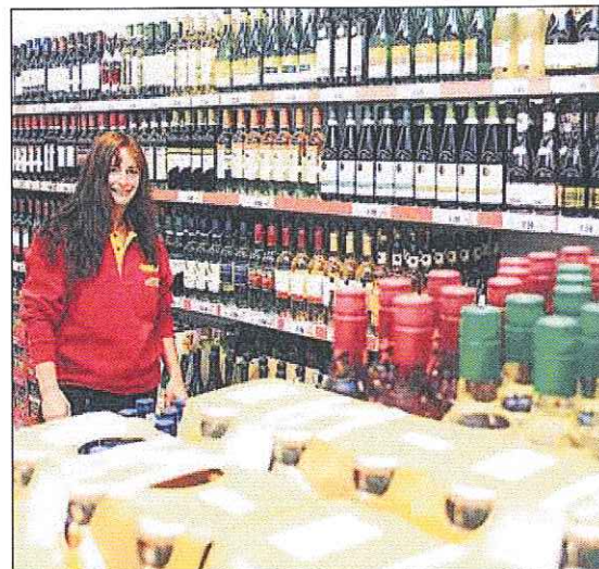
Spirituosen so weit das Auge reicht.