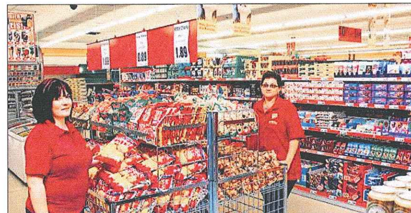
Süßigkeiten dürfen im Netto Marken-Discount nicht fehlen.